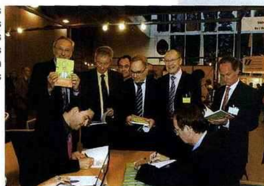
Différentes conventions de partenariats ont été signées à l'occasion du congrès