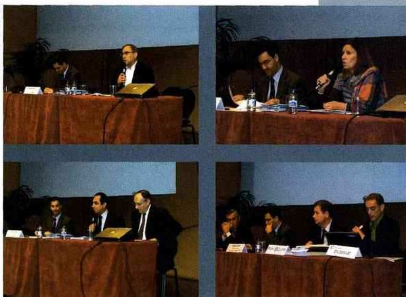
Les différentes commissions thématiques présentant leur rapport d'activité